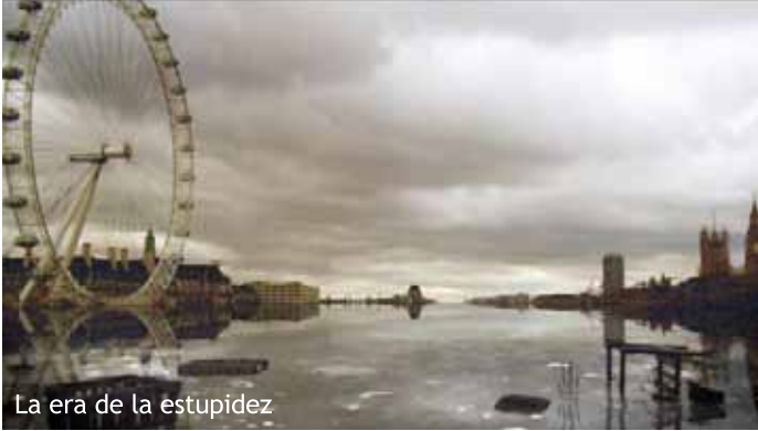
La era de la estupidez

sita una història per explicar el què pot ser la gran ciutat del futur, només imatges: edificis abandonats on només hi creixen plantes, deserts, ciutats inundades... En canvi l'anglesa Franny Armstrong va idear el trist exercici a La era de la estupidez (2009). El film, a cavall entre la ficció i el fals documental, explica com l'únic supervivent de la Humanitat, l'any 2055, troba uns arxius històrics en què explica què va passar al món i es pregunta per què no vàrem evitar el desastre ecològic quan encara hauríem pogut fer alguna cosa per salvar el món.