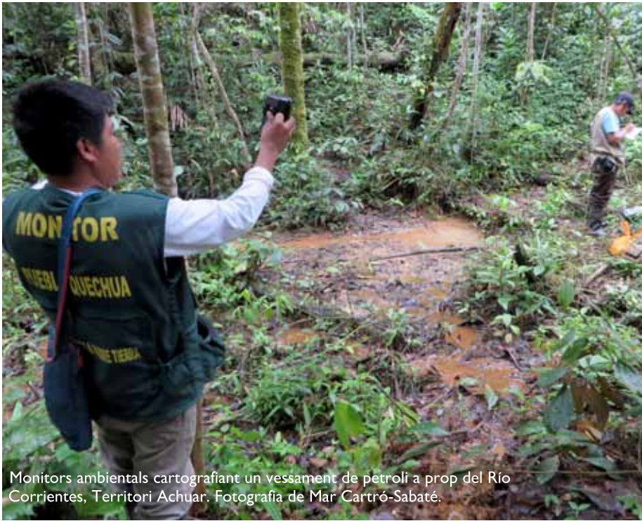
Monitors ambientals cartografiant un vessament de petroli a prop del Río Corrientes, Territori Achuar.

ser les societats que menys han contribuït als canvis ambientals -duent estils de vida amb una petjada ecològica negligible-, sofreixin de forma desproporcionada els seus impactes. Aquesta injustícia és explicada per vàries raons. Per començar, els indígenes acostumen a viure en àrees de risc que són particularment propenses als impactes dels canvis ambientals. En segon lloc, els pobles indígenes depenen directament dels recursos naturals per a la seva subsistència. Finalment, les seves actuals condicions econòmiques i socials són el resultat d'una llarga història d'exclusió social i marginació, fet que els limita a l'hora de defensar els seus drets i negociar estratègies d'adaptació als canvis ambientals.