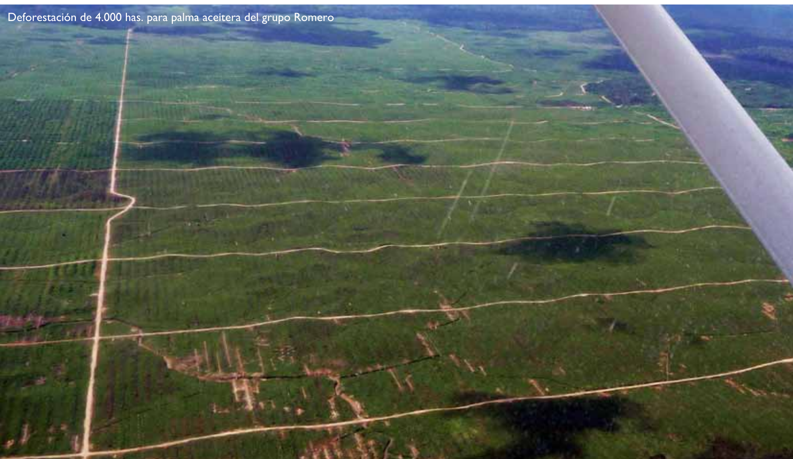
Deforestaci3n de 4.000 has. para palma aceitera del grupo Romero