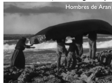
Hombres de Aran

A principis del segle XX, el director Robert J. Flaherty va convertir-se en el documentalista de referència d'aquestes comunitats. Primer amb Nanook el esquimal (1922), on mostrava les dificultats del mode de vida d'una família d'esquimals al Canadà, a la vegada que retratava l'alegria i la felicitat de viure tal i com ells volien; i els Hombres de Aran (1934), on feia el seguiment d'una família de pescadors que vivien a l'oest d'Irlanda, en un territori inhòspit i amb unes condicions de vida difícils.