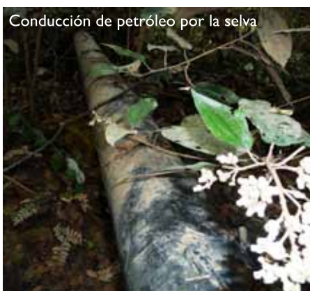
Conducci3n de petr3leo por la selva

El poblador de la Amazonia reacciona frente a este atropello de los bosques, pero se debilita y va viendo poco a poco como su medio ambiente va modific3ndose y se va hacien-