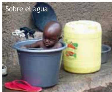
Sobre el agua

És el mateix cas del documental Nuestro Planeta (Yann Arthus-Bertrand, 2009), que denuncia com la terra, amb 4.000 milions d'anys d'antiguitat, es troba en perill després de només 200.000 anys d'existència de l'ésser humà. La Humanitat ha fet difícil la seva pròpia existència i la d'altres éssers vius, als quals s'està avocant a l'extinció, amb l'escalfament global, l'escassetat de recursos i la pràctica d'un consum sense control. I l'única manera de posar-hi solució és una actuació immediata de governs i societats.