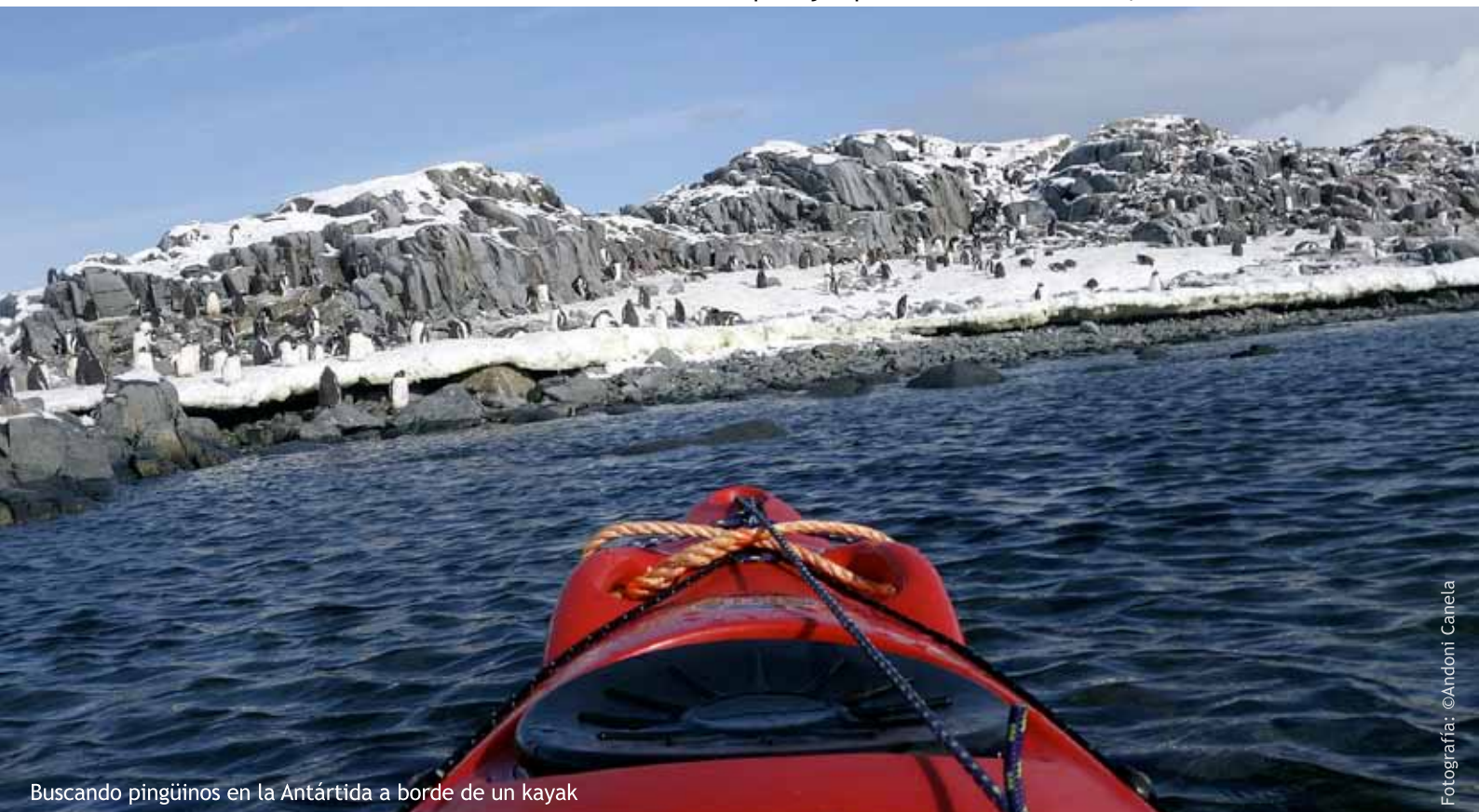
Buscando pingüinos en la Antártida a borde de un kayak

Cuando salimos ya lo hicimos con un proyecto educativo y ahora lo estamos desarrollando para explicar a los más jóvenes los problemas del Planeta. Cuando llevé a cabo el proyecto del Ártico, la exposición itinerante llegó a centenares de miles de personas en unas cincuenta ciudades y, además, también hay un proyecto educativo on line que lo lleva Fundación La Caixa. En ese proyecto trabaja Meritxell y un equipo con el cual estamos trabajando en proyectos similares que aúnan conservación, medio ambiente y educación.