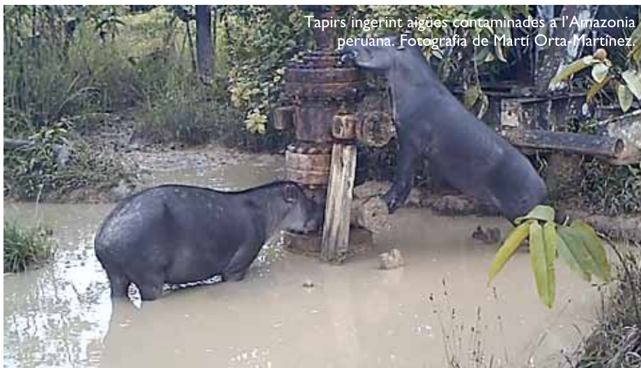
Tapirs ingerint aigües contaminades a l'Amazònia peruana.

i Orta-Martínez 2010). Entre oleoductes, dipòsits i jaciments de petroli viuen pobles indígenes com els achuar, els ashaninka o els nahua, tot debatent-se entre les seves formes tradicionals de subsistència i les oportunitats econòmiques i la degradació ambiental portades per les noves indústries. Les respostes són diverses: alguns lluiten contra la invasió de llurs territoris i els vessaments d'hidrocarburs, però d'altres acaben treballant com a peons en les empreses petroleres o negociant dotacions econòmiques com a compensació pels danys col·laterals de les explotacions. Així s'articula un procés d'assimilació a patrons occidentals i una sèrie d'impactes socials, culturals i ambientals irreparables. A grans trets, l'extracció petrolífera a l'Amazònia peruana genera tant conflictes com noves formes de resistència (Orta-Martínez i Finer 2010).