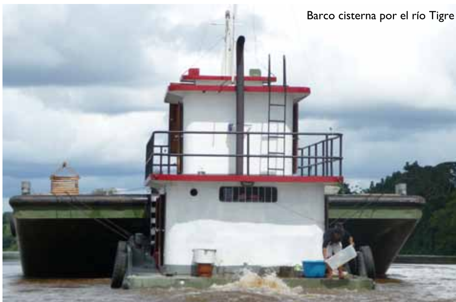
Barco cisterna por el r3o Tigre