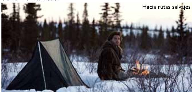
Hacia rutas salvajes

No obstant, de vegades, hi ha colibrís solitaris que horroritzats per les accions de l'home sobre la natura proven de retornar ells sols a l'estadi primitiu de l'home, per minimitzar el seu impacte sobre el medi, per "decréixer" i viure amb pau i harmonia amb la naturalesa, lluny del consumisme salvatge, somiant amb comunitats responsables i realitats alternatives. Com el poeta Henry David Thoreu, que va fugir als boscos per viure l'essència de la vida, ja que per ell, la majoria de luxes i comoditats eren un obstacle per a l'elevació espiritual de la Humanitat.