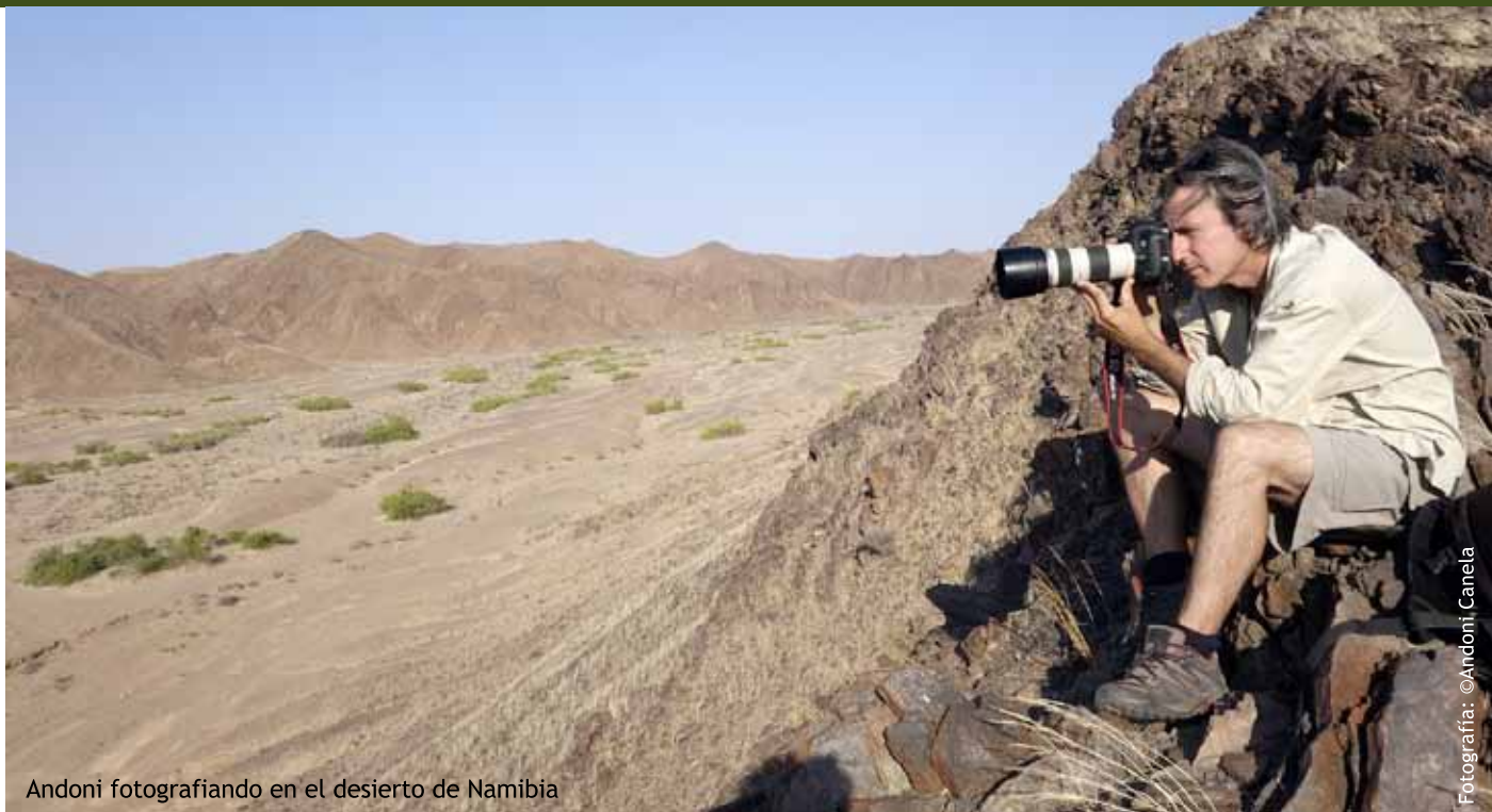
Andoni fotografiando en el desierto de Namibia