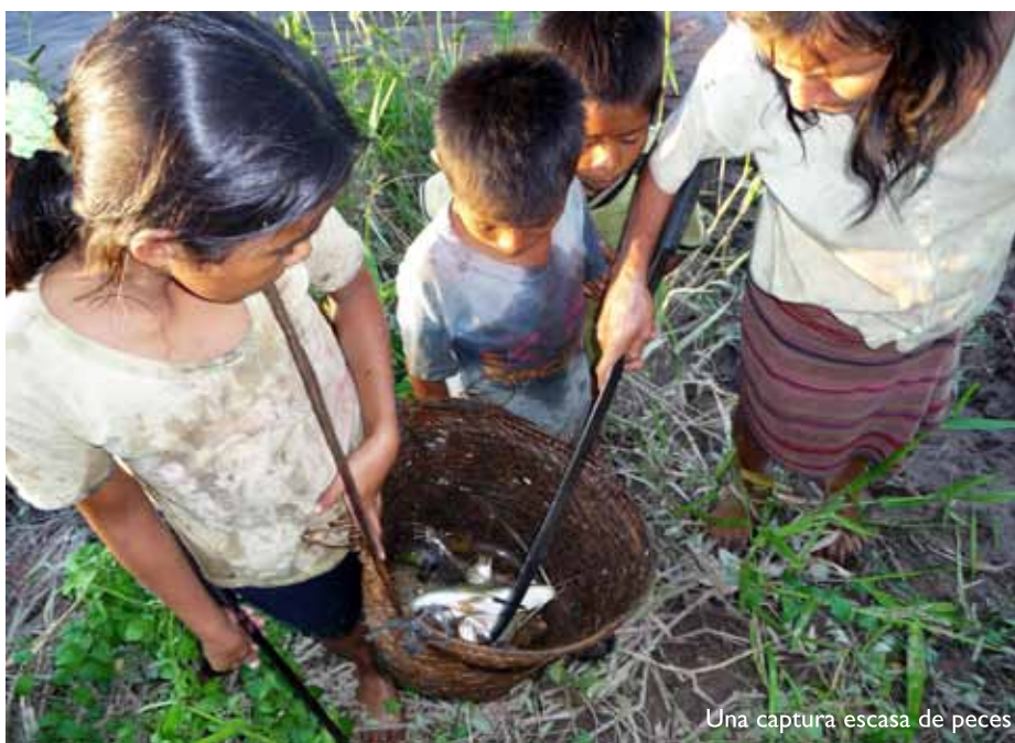
Una captura escasa de peces