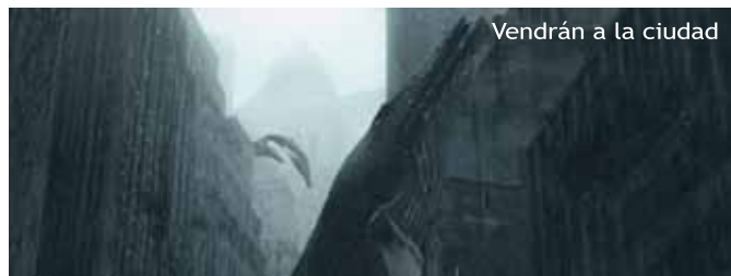
Vendrán a la ciudad

comunitats al món entorn l'aigua: de les inundacions a Bangladesh, la lluita per bidons d'aigua potable a Kibera (Nairobi) i el port abandonat d'Aralsk, a Kazakhstan. També l'aigua és l'objecte del documental Antes de la inundación: Tuvalu (Paul Lindsay), que explica com el canvi climàtic inundarà i farà desaparèixer l'illa de Tuvalu, a l'oceà Pacífic, d'aquí uns pocs anys.