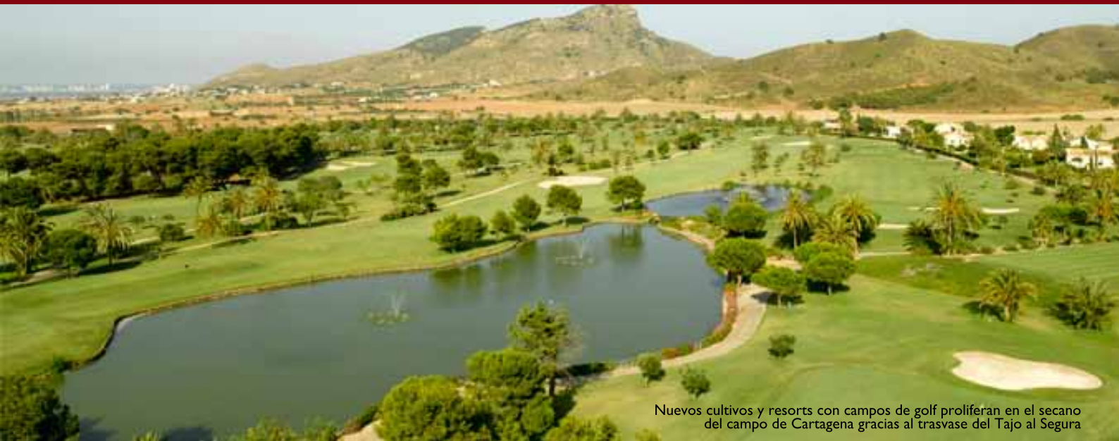
Nuevos cultivos y resorts con campos de golf proliferan en el secano del campo de Cartagena gracias al trasvase del Tajo al Segura

Profesor Em3rito del Dpto. de An3lisis Econ3mico de la Universidad de Zaragoza