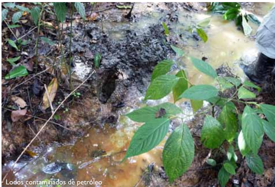
Lodos contaminados de petr3leo